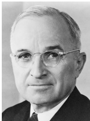
USA: Harry S. Truman