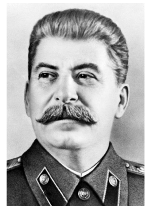
UdSSR: Josef Stalin